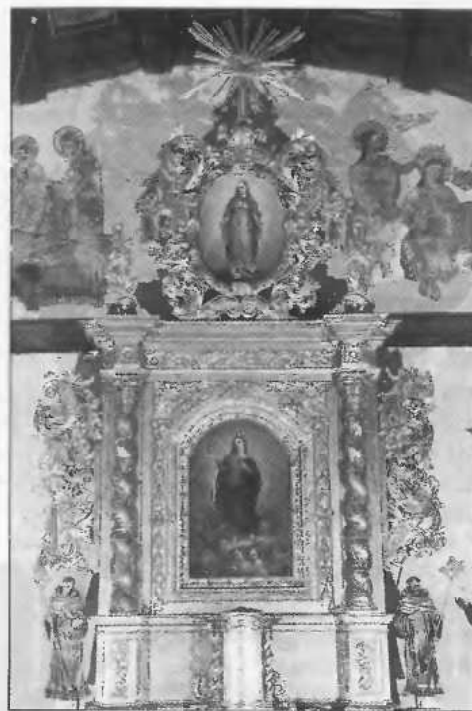
Ołtarz główny p.w. Wniebowzięcia NMP. Stan po konserwacji

Katolicy stopniowo odzyskiwali utracone świątynie, a w Bierzgowie, jak wspomniano, nastąpiło to dość szybko (koniec XVII w.). Pełnej rekatolizacji nie udało się jednak przeprowadzić. Dowodem na to niech będzie fakt, że na począt-